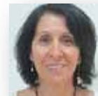
גאולה אזרחי תרבות

ושוב ברכות בציפייה לימים של עשייה ברוכה!