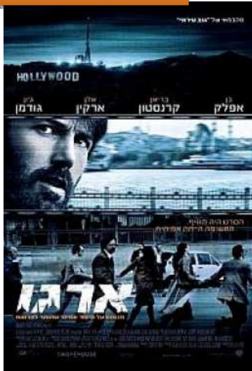
הסרט הטוב ב 2012