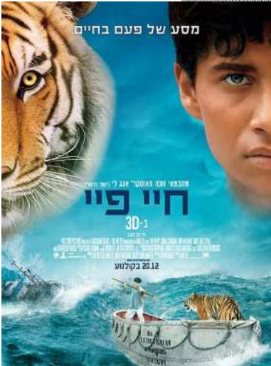
הבמאי הטוב ב 2012