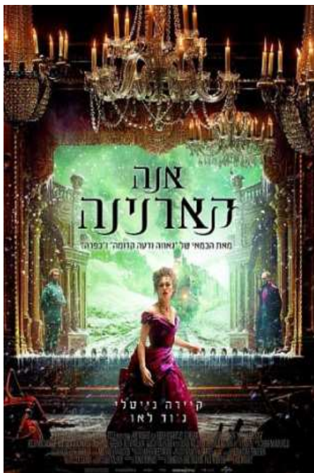
מוצ"ש 30 למרץ