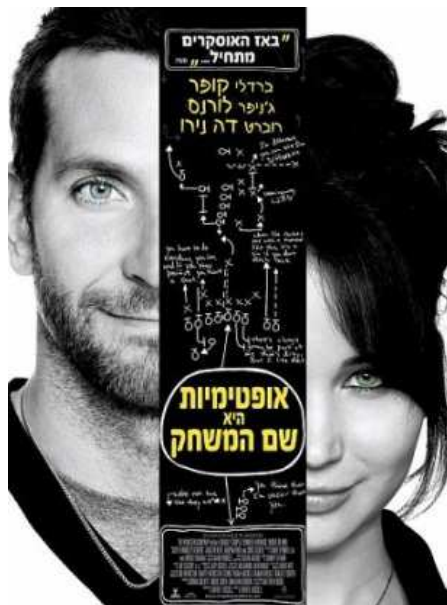
מוצ"ש 23 למרץ