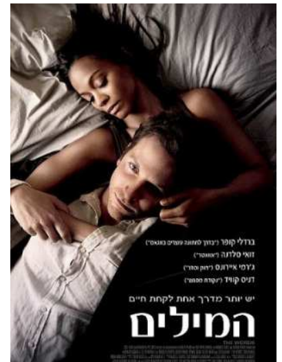
מוצ"ש 9 למרץ