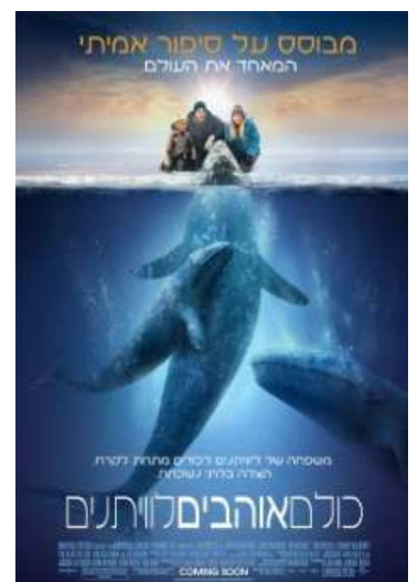
יום א 10 למרץ